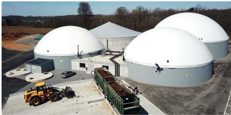
Salon à la ferme : colloque sur la méthanisation en ouverture

Dans le cadre du Salon à la Ferme, la Confédération Paysanne organise un colloque sur la méthanisation