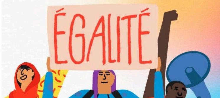
8 Mars 2024 Journée internationale des femmes

La Journée internationale des femmes, selon la terminologie de l'ONU, célèbre les efforts considérables déployés pour les femmes et les filles partout dans le monde pour façonner un futur plus égalitaire. C'est l'occasion de mobiliser en faveur des droits des femmes, de leurs luttes, et de leur participation à la vie politique et économique. Officialisée en 1977 par l'Organisation des Nations Unies, cette journée de sensibilisation est parfois détournée de son objectif d'égalité hommes-femmes, par des opérations commerciales à la connotation fortement sexiste.