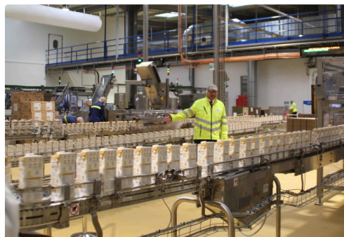
Danone 12022024 (19).JPG