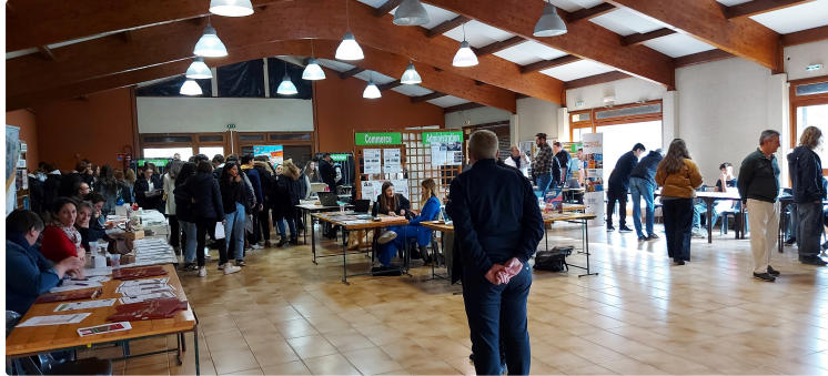
Près de 700 élèves de 3e peaufinent leur orientation sur le forum des formations !

La salle polyvalente de Vic-Fezensac n'a pas désempli jeudi dernier.