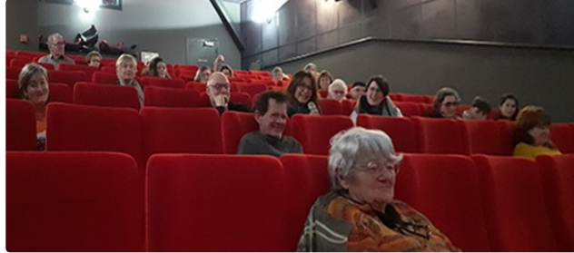
Une avant-première exquise au cinéma de l'Astarac

Cinéphilae dans le cadre du 17e Festival des images aux mots