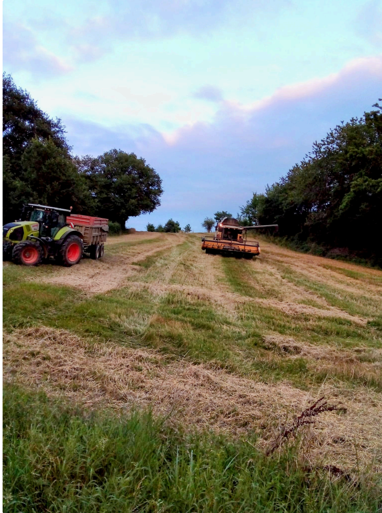
Le salon à la ferme ouvrira ses portes le 17 février

Comme chaque année depuis 3 ans la Confédération paysanne fait "salon" partout en France avec son évènement "le Salon à la ferme" qui précède le salon de l'agriculture parisien.