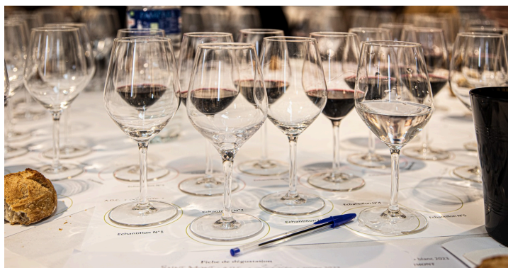
Les 8 verres d'un dégustateur (à ce moment 4 verres d'échantillons de rouge et un verre d'eau)

N.B. - Sur la photo du haut de page : la Galerie bleue devenue salle de dégustation.