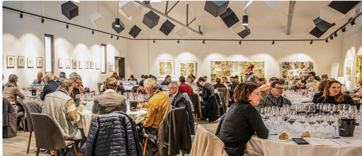
La grand-messe de l'assemblage du Faîte a eu lieu à Saint-Mont

Événement majeur de Producteurs Plaimont