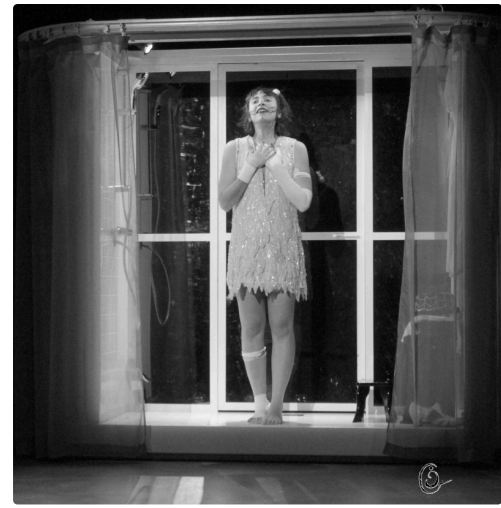
fille douche 2NB.jpg