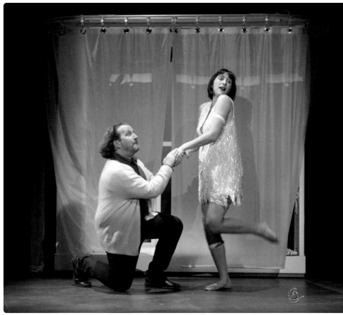
fil et fille 2 c nbred.jpg