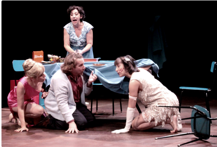
Moi aussi je suis Catherine Deneuve