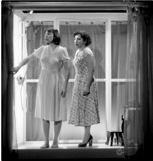
fille 2 et mère NB.jpg