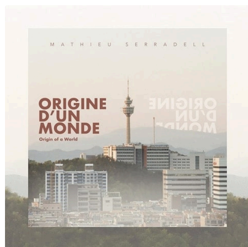
origine du monde .jpg