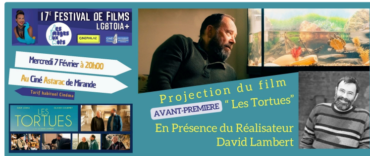
Du Festival de Cannes à Mirande.

Le festival Des Images Aux Mots, l'association Cinéphilae et le Ciné Astarac de Mirande vous propose de découvrir, 3 mois avant sa sortie en salle, le nouveau film du réalisateur et scénariste belge David LAMBERT: "LES TORTUES".