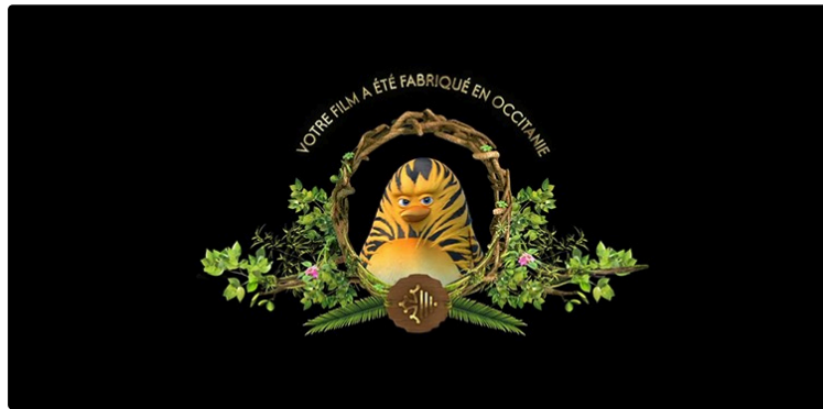
La production cinématographique se porte bien en Occitanie