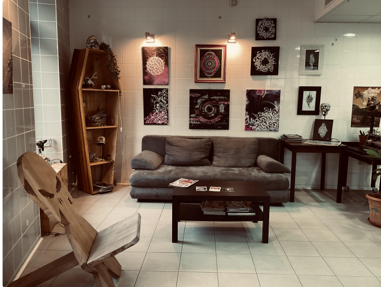
Nouveau ! Vic Ink Tattoo ouvre ses portes !

Situé place Crespin, le salon s'appelait Needle Art Tattoo, il devient Vic'Ink Tattoo et prend une autre dimension.