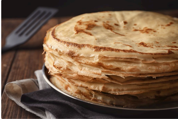
Un pape, du soleil, des galettes... et pas de chat, c'est la Chandeleur !