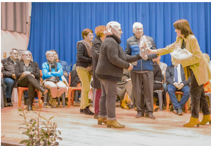
Distribution des récompenses

Les lauréats ont reçu un diplôme d'honneur, un bon d'achat de 20 euros et une plante, avec les félicitations de la municipalité et du jury de ladite Commission.