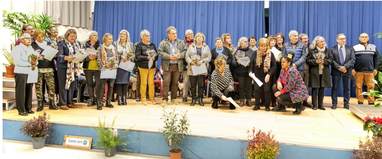
Palmarès du concours de fleurissement 2023 de Nogaro

Et remise du "Bouclier de Brennus des coccinelles"