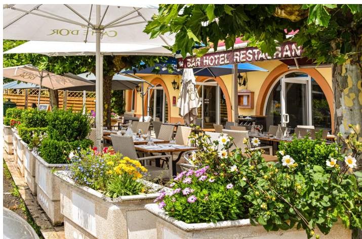
Bar-hôtel-restaurant Le Commerce