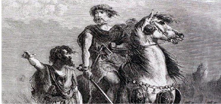
La tombe de chef de Pauilhac.