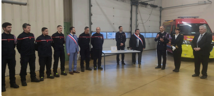
les sapeurs pompiers et leurs employeurs