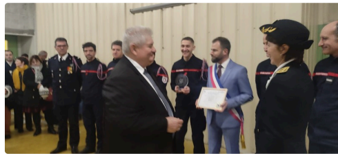
pompiers employeurs 3.jpg