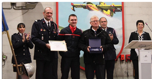
pompiers employeurs 5.jpg