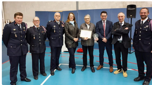
pompiers employeurs 1.jpg