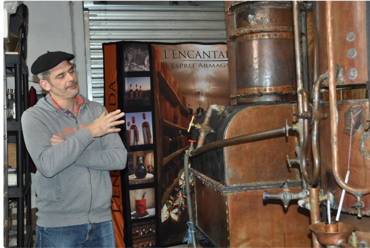
Première distillation à l'Encantada !

Pendant une semaine, l'Encantada a vécu sa première expérience de distillation dans son propre alambic.