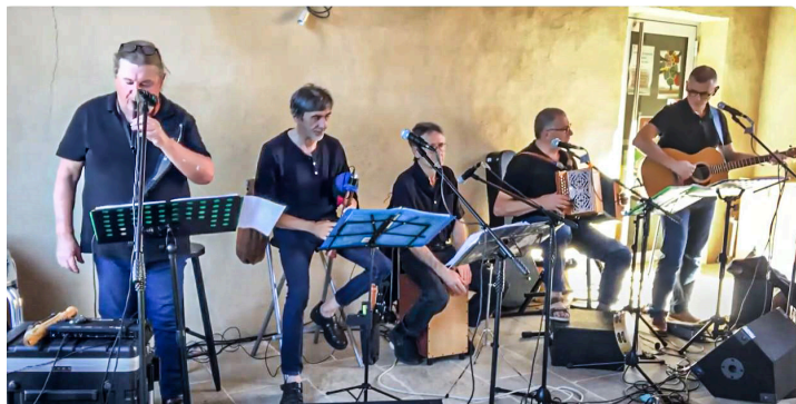
Hétz Beròi ( https://www.youtube.com/@HetzBeroi?app=desktop )

Une mention particulière pour l'action Made in Gers (Jobs d'été et réseaux solidaires) qui a déjà eu lieu ces 3 dernières années : il s'agit de mettre à la disposition d'étudiants des jobs exonérés de toute charge, avec hébergement et repas gratuits, en partenariat avec le Groupement d'employeurs 4 Saisons et la Maison familiale et rurale (MFR) d'Aire-sur-l'Adour.