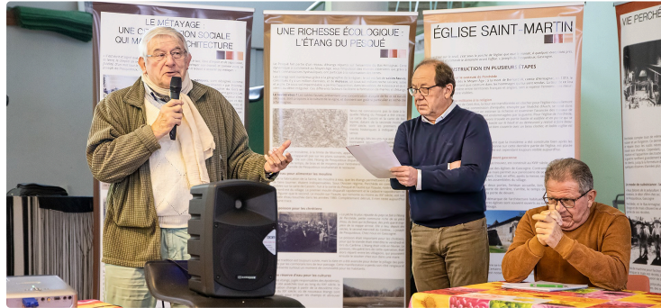
L'association Pimao, de Perchède, organise de nombreuses activités « durables »