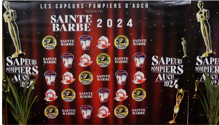
Auch et la Sainte Barbe 2024