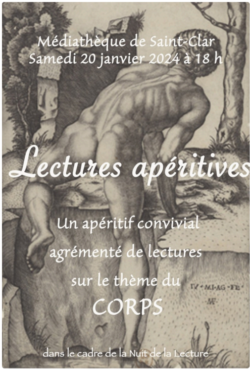
michel ange 1.jpeg