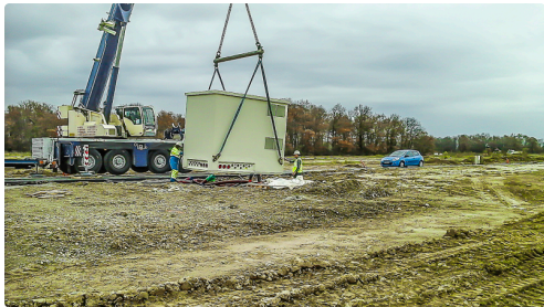
Mise en place d'un des transformateurs

Après ces travaux qui amènent l'électricité sur la zone d'activité, le Syndicat départemental d'énergies du Gers va réaliser la desserte intérieure, c'est à dire faire venir l'électricité sur chacun des lots, en fonction des besoins de chaque utilisateur.