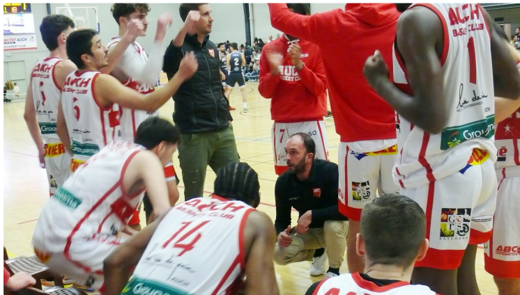
Auch se prend les pieds dans le tapis

Les Auscitains sont passés complètement à côté de leur match par manque de cohésion et d'adresse