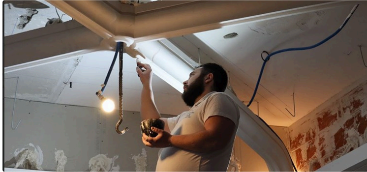
Journées Portes Ouvertes des Compagnons du Devoir