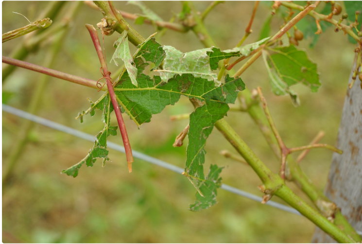
Indemnisation des pertes de fonds des calamités agricoles pour les intempéries du printemps 2023

Le caractère de calamité agricole a été reconnu sur plusieurs communes du département du Gers concernant les dégâts liés aux orages de grêle et aux excès de pluie du printemps 2023 (28 au 31 mai, 1 au 6 juin, 10 au 14 juin, 17-18 juin, 20 au 22 juin, 7-8 juillet).