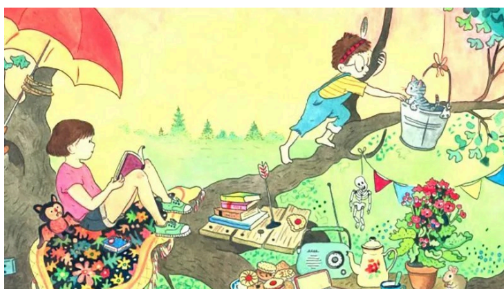
Illustration, Camille Jourdy, "Pépin et Olivia"