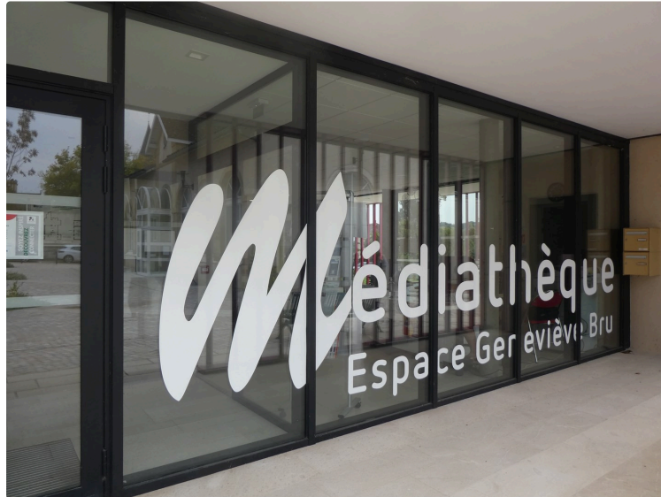
Le mois de janvier à la Médiathèque