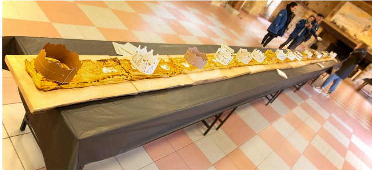
La réunion des vœux à Lupiac est celle d'un village heureux de se dépenser pour son héros d'Artagnan

Une gigantesque galette des rois offerte aux participants