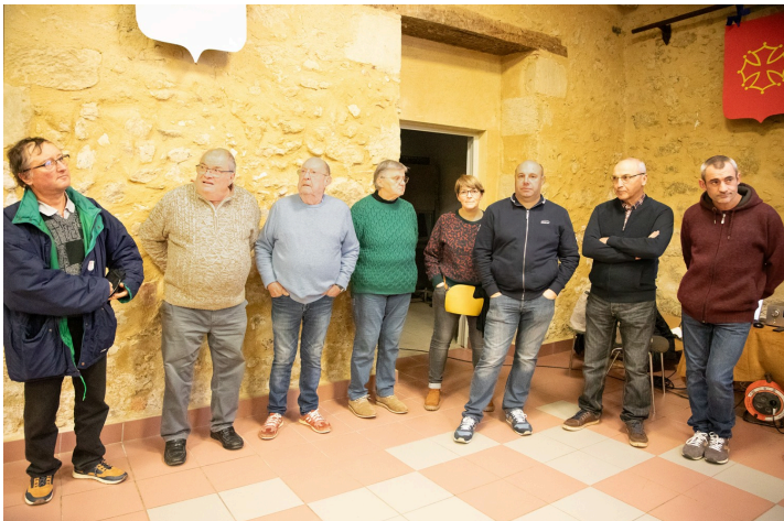
Les conseillers municipaux présents

Toute l'année, d'Artagnan est célébré par les villageois de Lupiac et grâce à eux. Au profit des touristes et des férus d'Histoire et de traditions. On peut en être sûr, cette activité, ce dynamisme totalement bénévoles au profit du célèbre mousquetaire, c'est pour le panache, un panache qui rend heureux et fier.