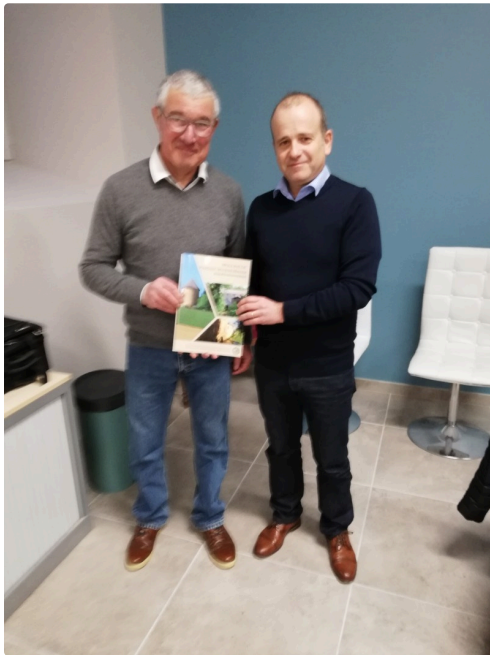
Montesquiou 03122023 (6).jpg