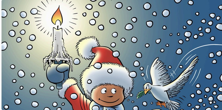
Avec les meilleurs vœux de Boule à Zéro

L'héroïne de la bande dessinée de Serge Ernst nous adresse ses meilleurs vœux.