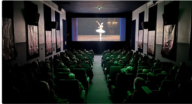
budget participatif régional : soutenez le projet du cinéma Europe