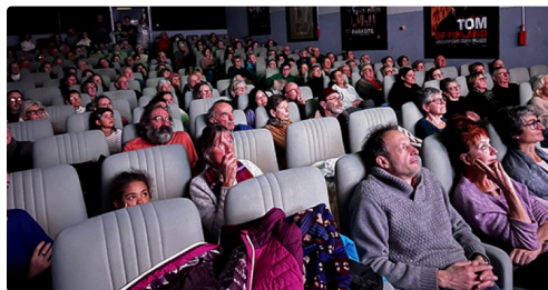
cine europe 2.jpg

Chacune et chacun des plaisantins, avec l'aide des gersois et de tous les départements d'Occitanie, peut contribuer à la réalisation de cette salle de convivialité en votant pour le budget participatif régional. Le projet y est décrit et il vous faudra donner quelques minutes de votre temps pour voter et faire voter votre famille et vos amis pour ce nouveau projet du cinéma l'Europe en allant sur internet et en marquant cineurope.fr/budgetparticipatif