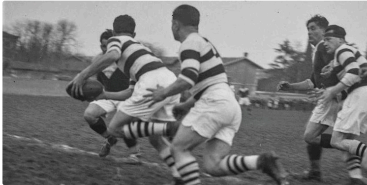
« Du coq à l'âme. Le rugby gersois au XXe siècle » disponible en librairie !

L'ouvrage Du coq à l'âme. Le rugby gersois au XXe siècle est désormais disponible dans les librairies suivantes :