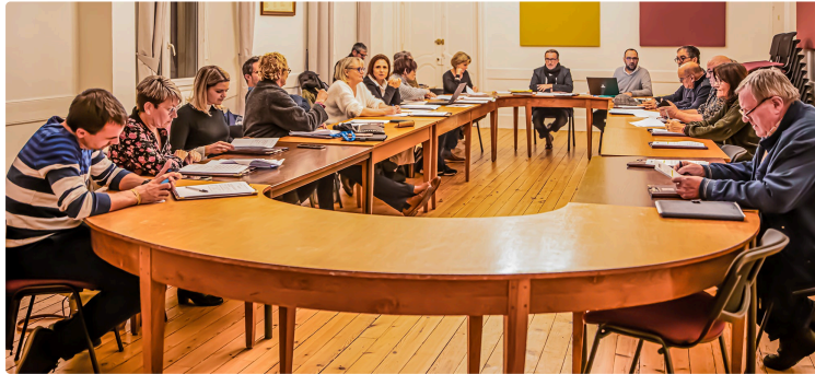
La Flamme olympique passera par Nogaro et autres infos