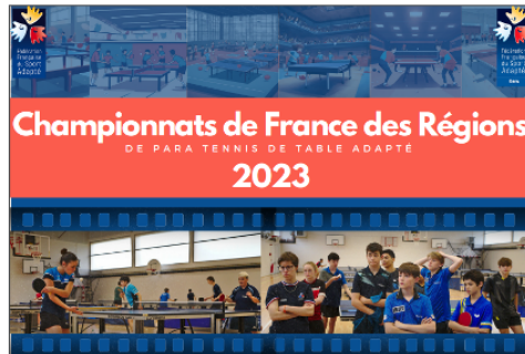
Le Championnat de France des Régions de Para Tennis de table Adapté, c'est ce week-end !

Le Comité Départemental de Sport Adapté du Gers développe dans le Gers les activités physiques et sportives adaptées pour le public en situation de handicap mental, psychique, ou avec Troubles du Spectre Autistique (TSA).