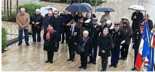
Une commémoration dans le froid et sous la pluie

Depuis 20 ans, la date du 5 décembre est officiellement désignée comme étant la journée nationale d'hommage aux « morts pour la France », aux rapatriés, aux personnes disparues et aux victimes civiles pendant la guerre d'Algérie et les combats du Maroc et de la Tunisie.