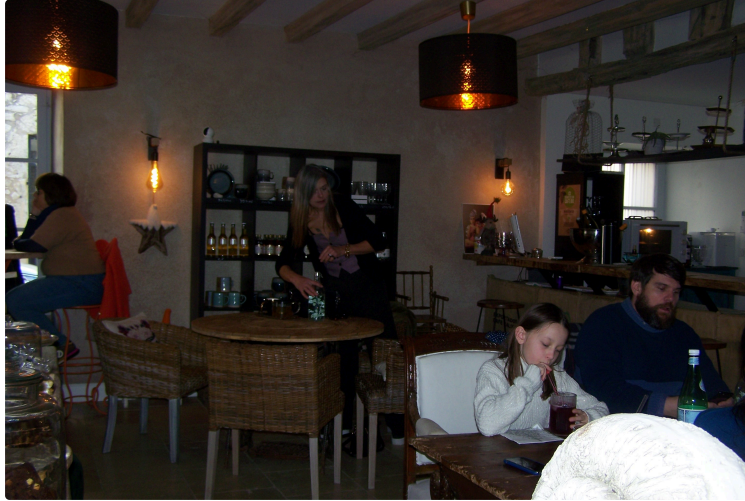
Un petit tour en images sur le marché de Noël à Saint-Clar.

Photo : Intérieur de l'espace de "Croc'q La Vie"