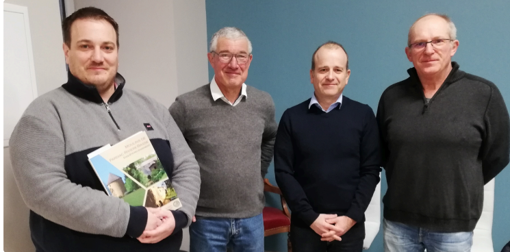
Les moulins de Pardiac Rivière-Basse

Samedi dernier, à Montesquiou, Il n'était point question de la comptine « Meunier tu dors... » mais de la riche enquête détaillée du recensement des moulins du canton Pardiac Rivière Basse (Plaisance, Marciac, Montesquiou).