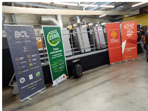
Tout est prêt pour inaugurer la presse OFFSET XL 106 4 + VERNIS.

Après les remerciements à tous les principaux partenaires et des félicitations à Perrine Crochet de la CMA du Gers « qui a beaucoup œuvrée pour l'organisation de la journée », les gérants de BCR concluront : « BCR c'est aujourd'hui 33 années d'existence, 20 collaborateurs, 800 tonnes de papier transformé et 4,3 M de CA. Une organisation qui nous permet de produire en 3x8 et de couvrir la plage horaire journalière pour les enlèvement/livraisons ainsi que l'accueil phoning et le traitement des fichiers et BAT de 7 h à 20 heures non STOP. Maintenir un haut niveau de Qualité, réactivité, service, est notre objectif principal ».