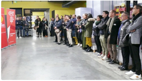
Invités et salariés de BCR.