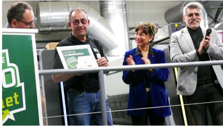
BCR imprimeur conseil : d'une pierre, deux coups

Mardi 28 novembre a été remis par la CMA à l'entreprise, le label "Zéro déchet " et inauguré la fabuleuse presse OFFSET XL 106 4 + VERNIS