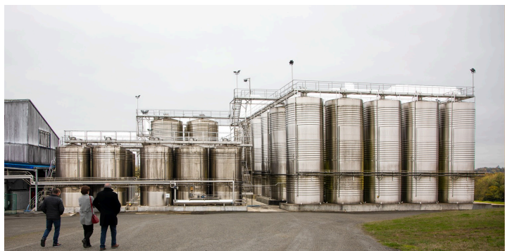
Vers la nouvelle cuverie bâtie en 2018

Actuellement, 1 250 ha de vigne sont exploités par les 52 adhérents de la Cave. Et celle-ci a 24 employés.