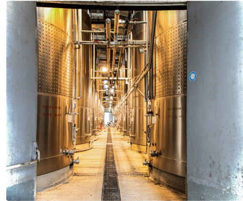
Cuverie intérieure sans cercles