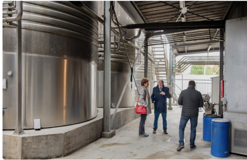
Au pied des cuves extérieures