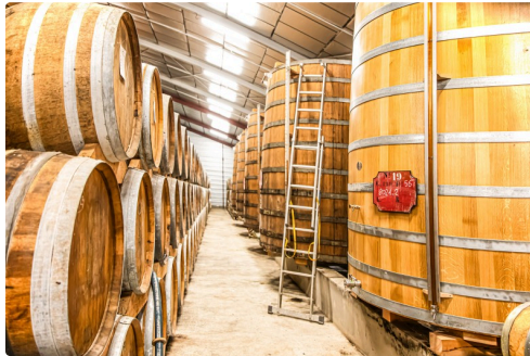
Foudres et barriques d'Armagnac