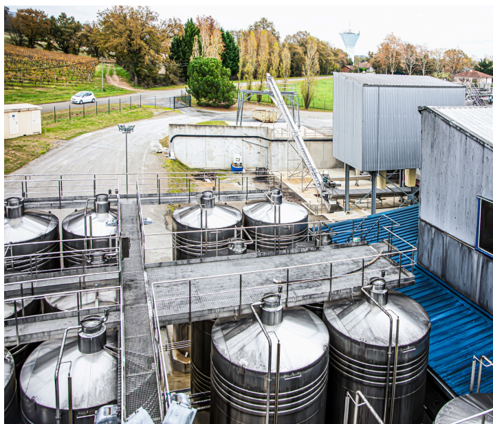
Vue sur les cuves les plus basses

En 2018, pour satisfaire les demandes de GCF, HDM a recruté de nouveaux adhérents et a investi dans un outil de travail plus moderne : pressoirs, cuverie, matériel de vinification, chaîne d'embouteillage et matériel d'évacuation des effluents.