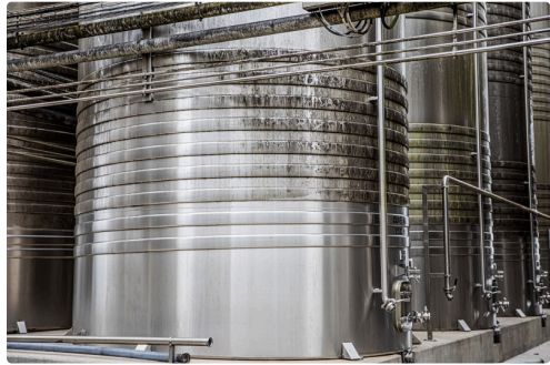
Noter les cercles de refroidissement sur les cuves situées à l'extérieur

HDM fait environ 10 millions d'euros de chiffre d'affaires et dispose de 7,2 millions d'euros de capitaux propres.