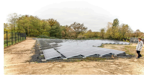
Le champ photovoltaïque