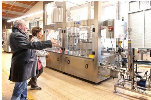
La chaîne d'embouteillage