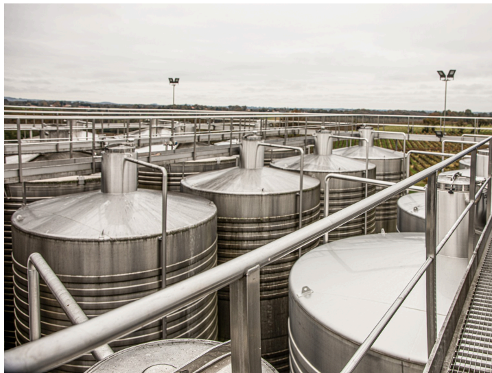
Tout en haut des cuves

Par ailleurs, pour l'Armagnac, le Floc, les 20 % de vin qui sont mis en bouteille et autres produits conditionnés, la Cave les vend elle-même en France et à l'étranger (dans 40 pays) avec l'aide de deux commerciaux.