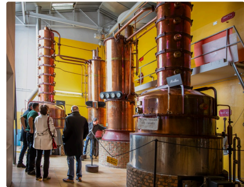
La distillation des alambics Athos, Porthos et Aramis