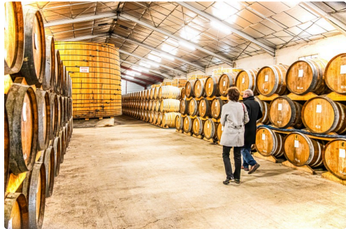
Le chai d'Armagnac