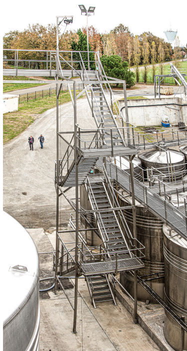
Cet escalier mène en haut des cuves à claire-voie (à 25 m)

Patrick Farbos est président depuis 2009. En 2011 une décision capitale a été prise, vu les difficultés de la vente du vin à l'époque : HDM s'engage, par un contrat valable 10 ans, à fournir toute sa récolte de vin blanc en vrac à Grands Chais de France (GCF). Et ce contrat a été renouvelé pour 10 ans.