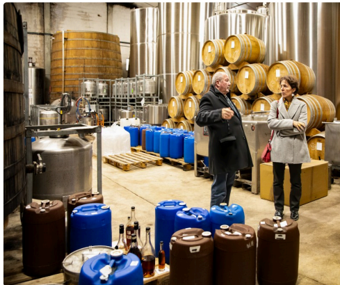
Dans le chai des très vieux Armagnacs