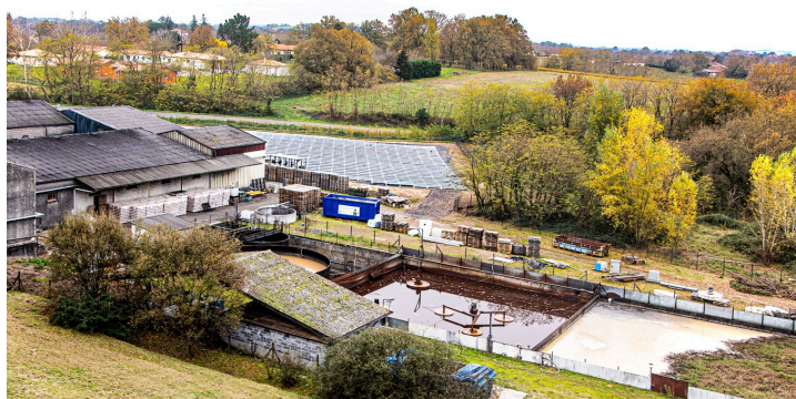
Au 1er plan, le réceptacle des effluents ; en arrière-plan, le champ photovoltaïque

Par ailleurs, pour l'Armagnac, le Floc, les 20 % de vin qui sont mis en bouteille et autres produits conditionnés, la Cave les vend elle-même en France et à l'étranger (dans 40 pays) avec l'aide de deux commerciaux.