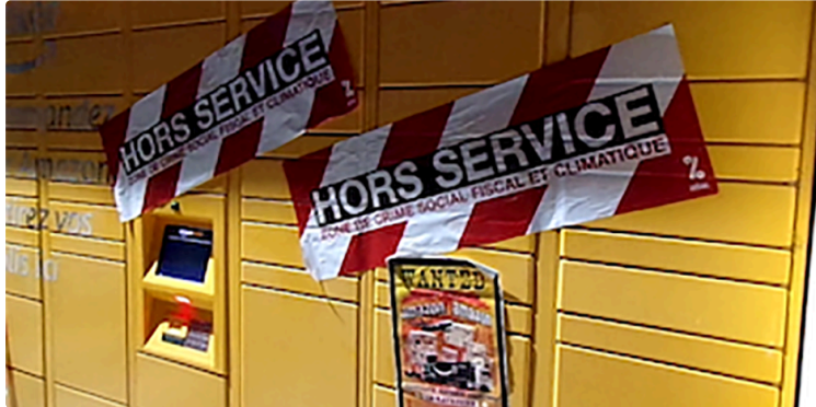
Des consignes Amazon mises hors service à l'occasion du «Black Friday»