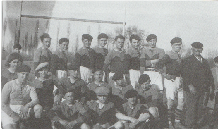
Le béret français dans tous ses états !