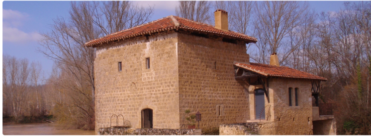
Sur les traces des moulins

Etienne Verret, maire de Montesquiou, en collaboration avec Montesquiou Patrimoine vous convie à la présentation du livre