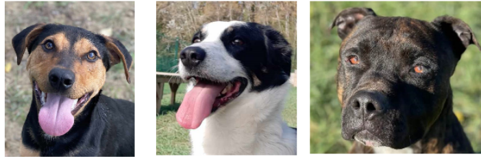
Les tout jeunes Jack et Bob et l'attachant Oreo à l'honneur cette semaine

Cette semaine, la SPA vous présente deux tout jeunes chiens qui viennent d'avoir un an, Jack et Bob, et le coup de coeur de la semaine Oréo.