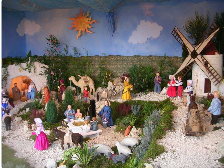
La Ronde des Crèches célèbre Marcel Pagnol !

La 28e édition de la Ronde des Crèches se déroulera