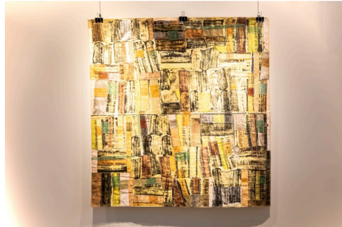
5 tableau de Michel Danton 1bis 161123.jpg