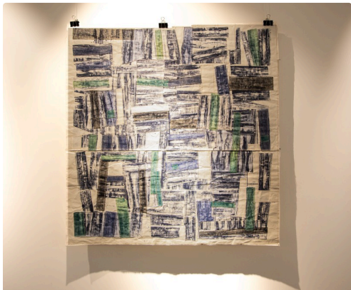
7 tableau de Michel Danton 1bis 161123.jpg