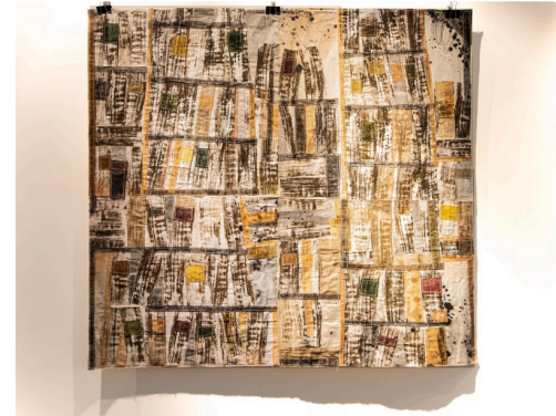
6 tableau de Michel Danton 1bis 161123.jpg