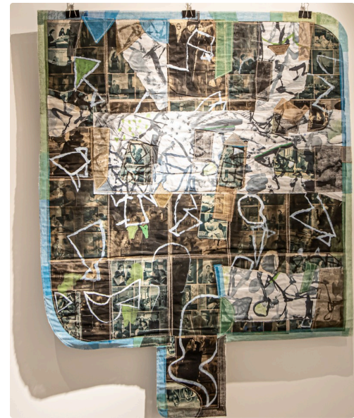
3 tableau de Michel Danton 1bis161123.jpg