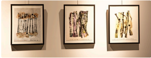
4 3 tableaux de Michel Danton 1bis161123.jpg