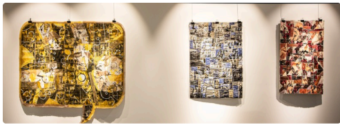
1 3 tableaux de Michel Danton 1bis161123.jpg