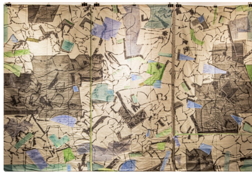
2 tableau de Michel Danton 1bis161123.jpg