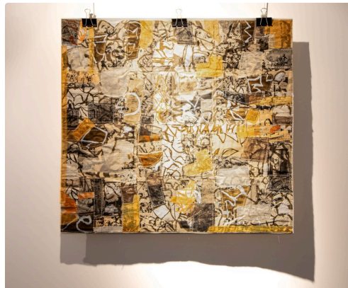
8 tableau de Michel Danton 1bis 161123.jpg