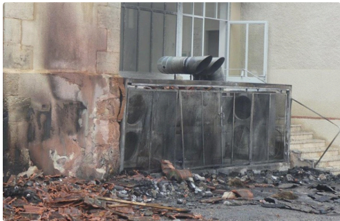
point de départ du sinistre