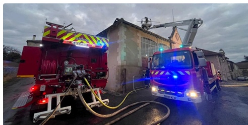
d'importants moyens déployés