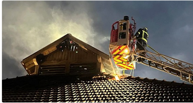
La salle des fêtes détruite par un incendie

Vision d'apocalypse ce matin au fond de la rue Gambetta à Seissan, un incendie a entièrement détruit la salle des fêtes,