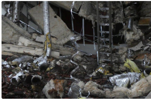
le feu a fait des ravages