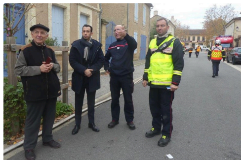
L'adjoint au maire, le sous préfet de Mirande, le