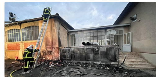
la propagation limitée