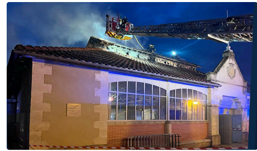
intervention depuis l'échelle aérienne