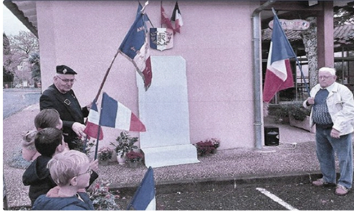
Première cérémonie du 11 novembre depuis la grande guerre

La commune sera l'an prochain dotée d'un monument aux morts