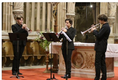
Les élèves du conservatoire