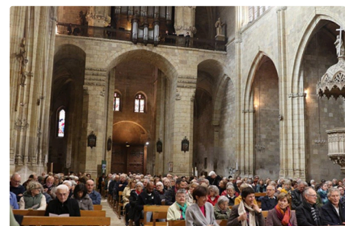
Le public très nombreux