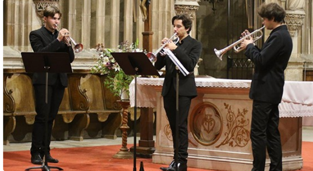
Un concert qui emporte son public

Un grand moment musical dans la cathédrale Saint Pierre,