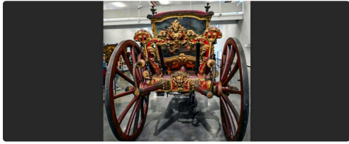
Les roues cintrées vers l'intérieur