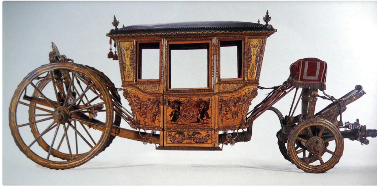
Lupiac nous appelle: Participez à la construction du carrosse d'apparat de d'Artagnan!

Ce sera l'attraction du Festival d'Artagnan en août 2024