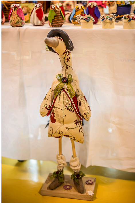
Un canard très élégant