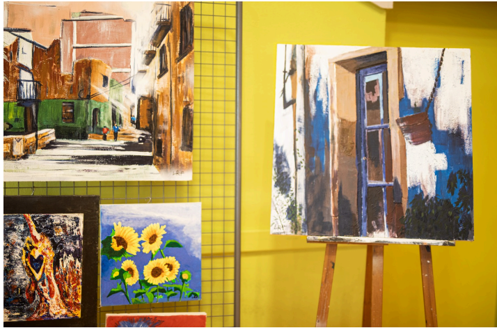
Tableaux de Roy Laffargue-Langner