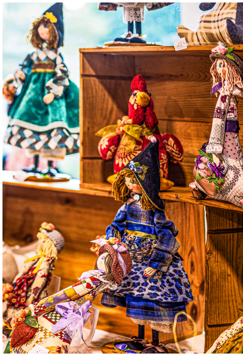
Des poupées entièrement faites main