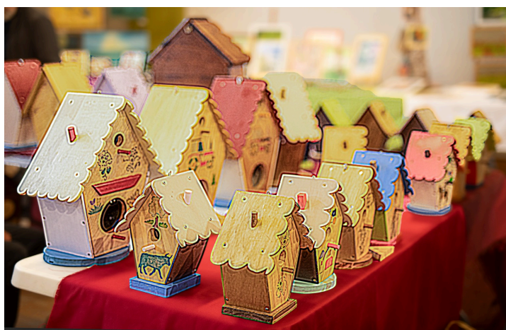
Des refuges pour les oiseaux