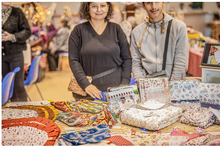
Nappes et napperons