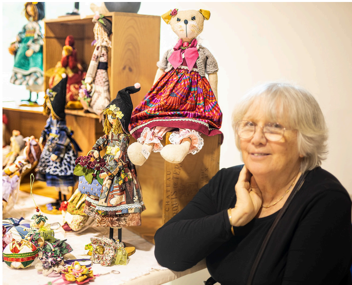
La dame qui fabrique poupées et canards