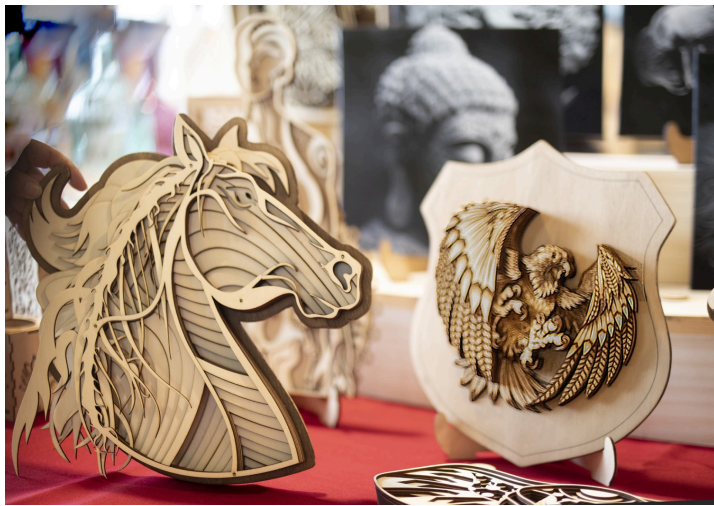
Sculptures en bois de peuplier