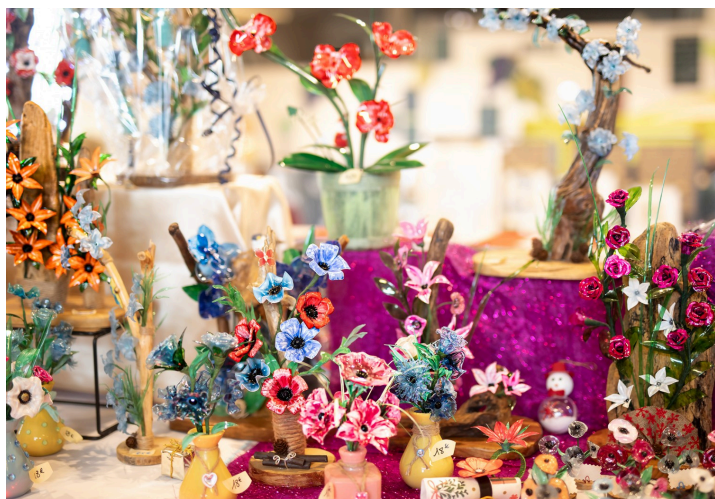
Des fleurs à partir de bouteilles en plastique