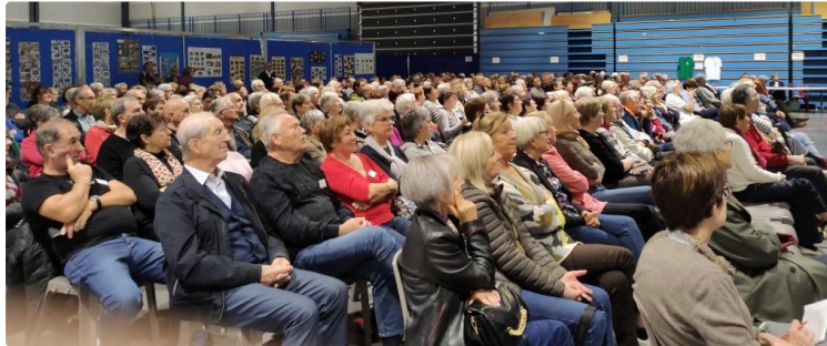
CRSA : l'Assemblée Générale

une association qui ne manque pas de peps ... et d'adhérents