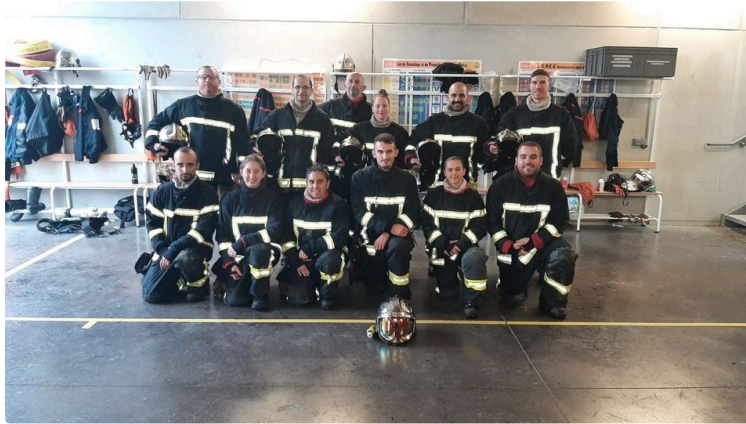
SDIS 32 : formation incendie au centre de secours

Du 21 octobre au 4 novembre, 11 stagiaires des centres d'incendies et secours de Gimont, Gondrin, Le Houga, Lombez, Mirande, Pavie et Simorre ont participé à une formation incendie qui s'est déroulée au centre de secours de Vic-Fezensac.